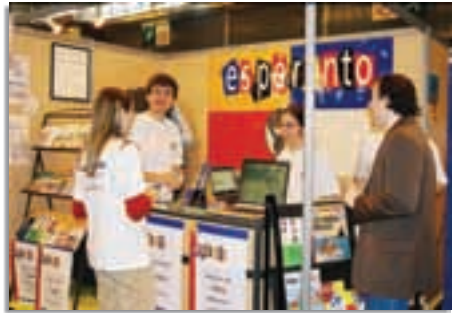
Le stand Esperanto-France au salon Expolangues